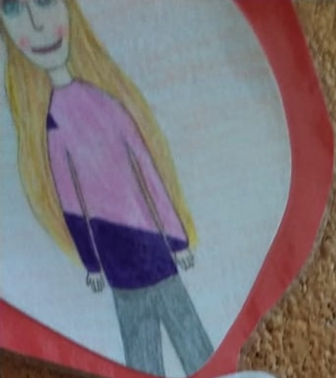
Ebinka je naše šmoulinka.