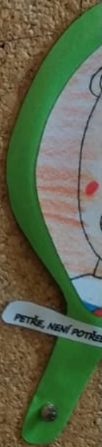
PETŘE, NEJÍ POTŘEBA