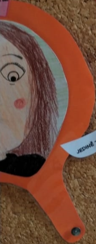
JEDINĚ TY MILÁ NELOI