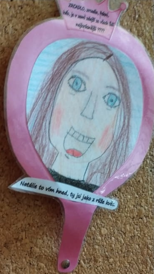
ZRCADLO, zrcadlo, Petri, kdo, je v zemi zdejší ze všech lidí nejkrásnější ???? Nadšle to vím hned, ty jsi jako z růže květ.